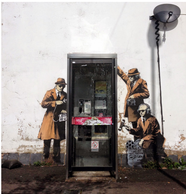
La surveillance de masse selon la star de l'art urbain Banksy, à Londres.

C'est tout un paquet de mesures pour lutter contre le terrorisme que Xavier Bettel a présenté à la Chambre, cette semaine. Mais la définition du terrorisme reste floue et la porte à d'éventuels abus, grande ouverte.